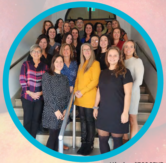
L'équipe d' ECOGENE-21

ECOGENE-21 a mis en place un réseau de centres de recherche clinique et translationnelle (CRCT) afin notamment de fournir un environnement multidisciplinaire, enrichissant et stimulant pour les cliniciens et les chercheurs tout en permettant d'améliorer l'accès à des traitements innovants pour la population. Nous exécutons ainsi plus d'une trentaine d'essais cliniques simultanément allant de la phase I à la phase III, et ce, pour un total de plus de 300 études cliniques conduites depuis notre création. Notre équipe est composée de 35 personnes, toutes possédant une formation et une expertise riche et complémentaire, incluant des médecins généralistes et spécialistes, des infirmières auxiliaires, des infirmières,